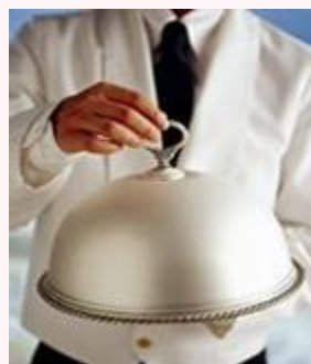
Atender a los comensales