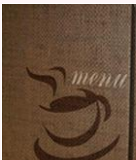
Dar información de los platillos que allí sirven