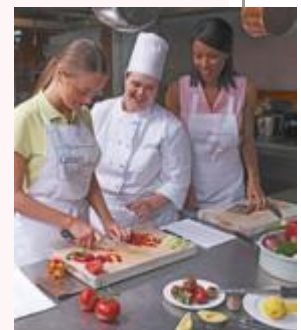
Preparar los alimentos

Las relaciones son, por ejemplo, la de que el garzón o mesero informa al cocinero sobre los platos solicitados